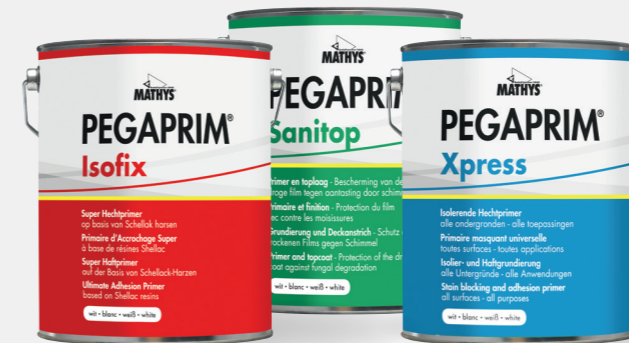
Pegaprim® Xpress - Pegaprim® Isofix - Pegaprim® Sanitop

Für ein prächtiges Endergebnis beginnen Sie mit ... PEGAPRIM® Primern!