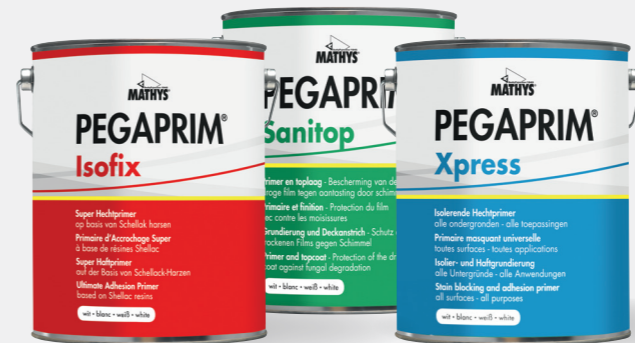
Pegaprim® Xpress - Pegaprim® Isofix - Pegaprim® Sanitop

Pour un résultat final magnifique, commencez par... des primaires PEGAPRIM® !