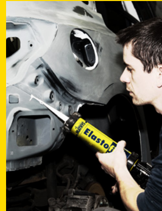
Alles wat je wil, kun je vullen met Elastofill