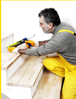
Alles wat je wil, kun je voegen met Elastofill