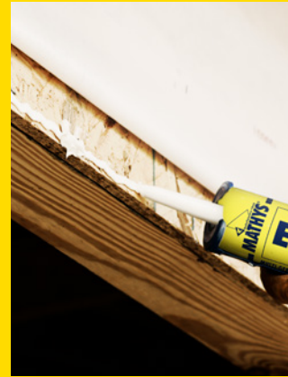
Alles wat je wil, kun je lijmen met Elastofill