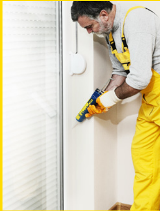
Alles wat je wil, kun je kitten met Elastofill